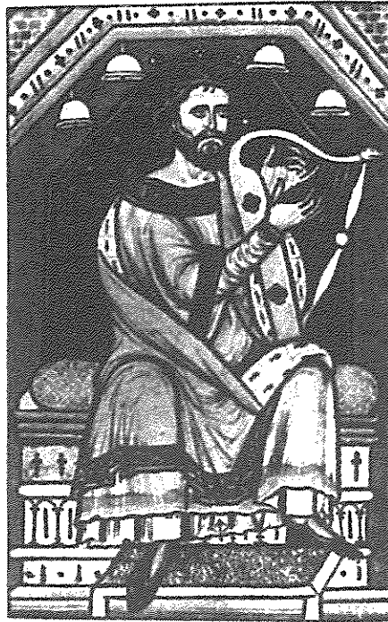
A hárfázó Dávid király ábrázolása. Miniatura a Westminster apátság pasaltériumból. (XII. század, London British Múzeum).

Izrael gyakran megfélemedezett arról, hogy ki az az Isten, aki őket vezeti, aki kihozta őket Egyiptomból, aki nekik adta az ígéret földjét, és aki megváltót ígért nekik bűneik bocsánatára és bűneik végső eltörlésére. Sokszor visszatértek a bálványimádáshoz. Dávid itt arra buzdítja őket, hogy vigadjanak, mert igaz Isten vezeti őket, aki uralkodik az egész földön. Dávid bűnének következménye viszont ismétlen odavezetett, hogy egyre többen fordultak el az Úrtól. „Az istenfélelem Izraelben elvesztette korábbi erejét és sokak szemében elhalványult a bűn utálatossága, ugyanakkor azokat, akik nem szereték és nem félték Istent csak felbátorította a törvényszegésre” (E.G. White: Pátriárkák és Proféták ).