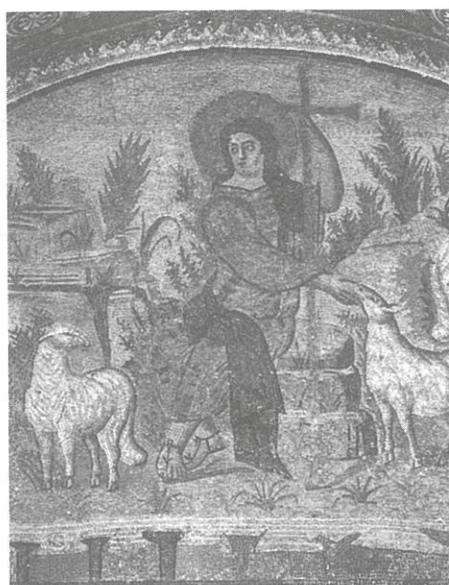
Krisztus mint pásztor. Mozaik falkép Galla Placidia császárné sírkápolnájából. Ravenna, 440 körül.

„Jöjjetek velem...” Most is, mint életünk minden napján magához hív bennünket. Hív minket örömmel és bánatunkkal együtt. Minden élethelyzetben van szava hozzánk. Ha kell bátorít, ha kell erőt ad, amikor kell vigasztal bennünket. Lehetőségünk van arra, hogy tanítására figyeljünk, és lehetőségünk van arra, hogy közelében legyünk. Az események, ünnepek pergése után is hív minket. Megszólal és megszólít a hétköznapokban, de nem hét-